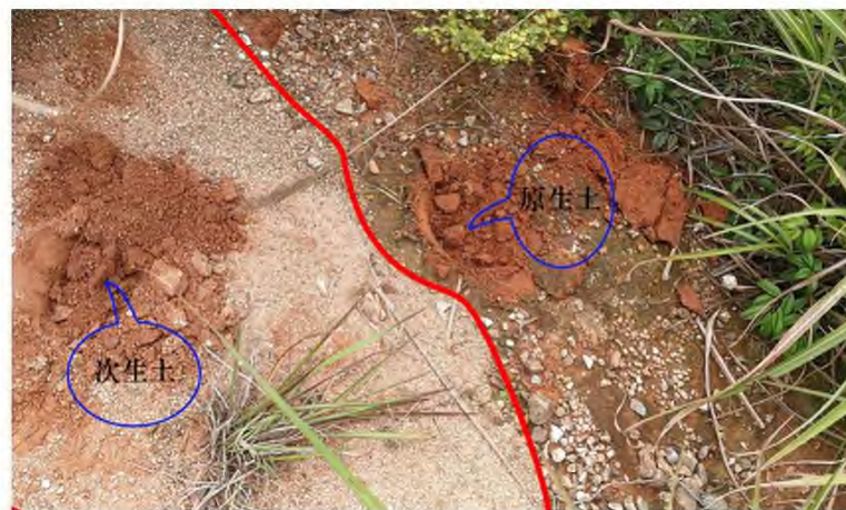
图1 原生土与次生土特征对比

以第四系沉积和白垩系红层为主的盆地内,采样图斑以实际样点的地球化学属性进行图斑赋值,