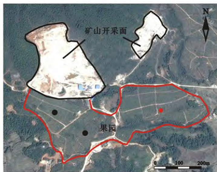
黑色为原有部署点,红色为补充点

生态地质综合调查可基本查明土壤母质成因来源、土地利用变化、污染源分布等影响样品代表性的因素,从而为样点布设提供依据。如在林地变更为园地时,园地样品需进行布点;在发现矿山污染开采面、尾矿库时,增加样点布置;在农业基地中,增加样点布置;在发现不同土壤母质成因类型时分开布置样点等。如图5所示,果园正好位于矿山开采面南部地势较低处,若仅考虑西部的开采面,原布是基本准确,但在发现东部的矿山开采面以后,需增加东部的果园布设样点进行控制。