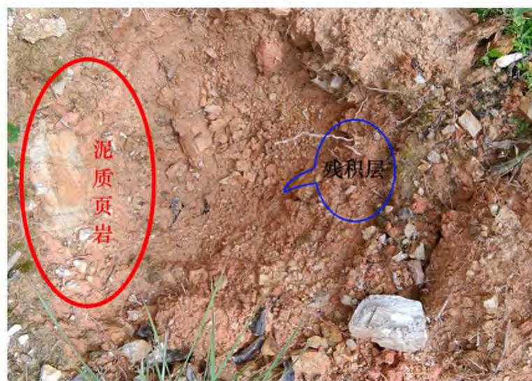
图2 松软的残积层特征