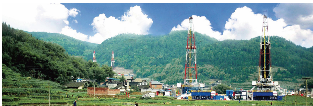
图 4 重庆涪陵页岩气“井工厂”作业模式

二是采用“井工厂”作业模式，节约利用土地。在页岩气开发过程中采用“井工厂”作业模式和丛式钻井技术(图 4)，有效控制井场占地面积，减少对地表植被的破坏。在页岩气勘查开发过程中，注重天然林保护和矿区环境绿化，对井场及时开展土地复垦工作，实现了“边生产、边建设、边复垦”，建立了页岩气资源有效开发的绿色发展模式。