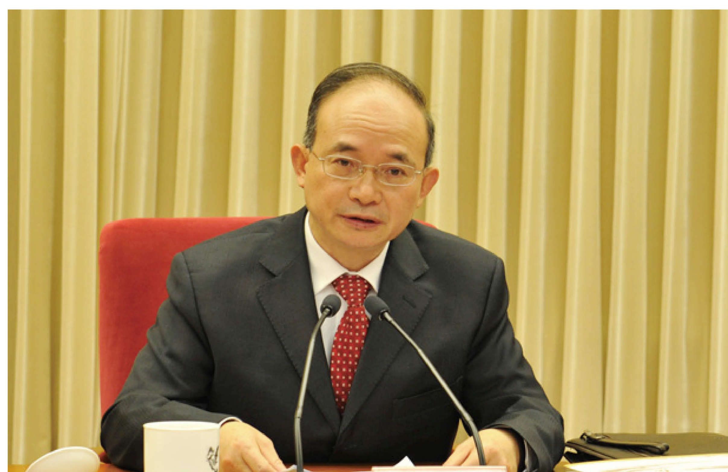
钟自然局长主持中国地质调查科技创新大会暨纪念中国地质调查百年学术研讨会