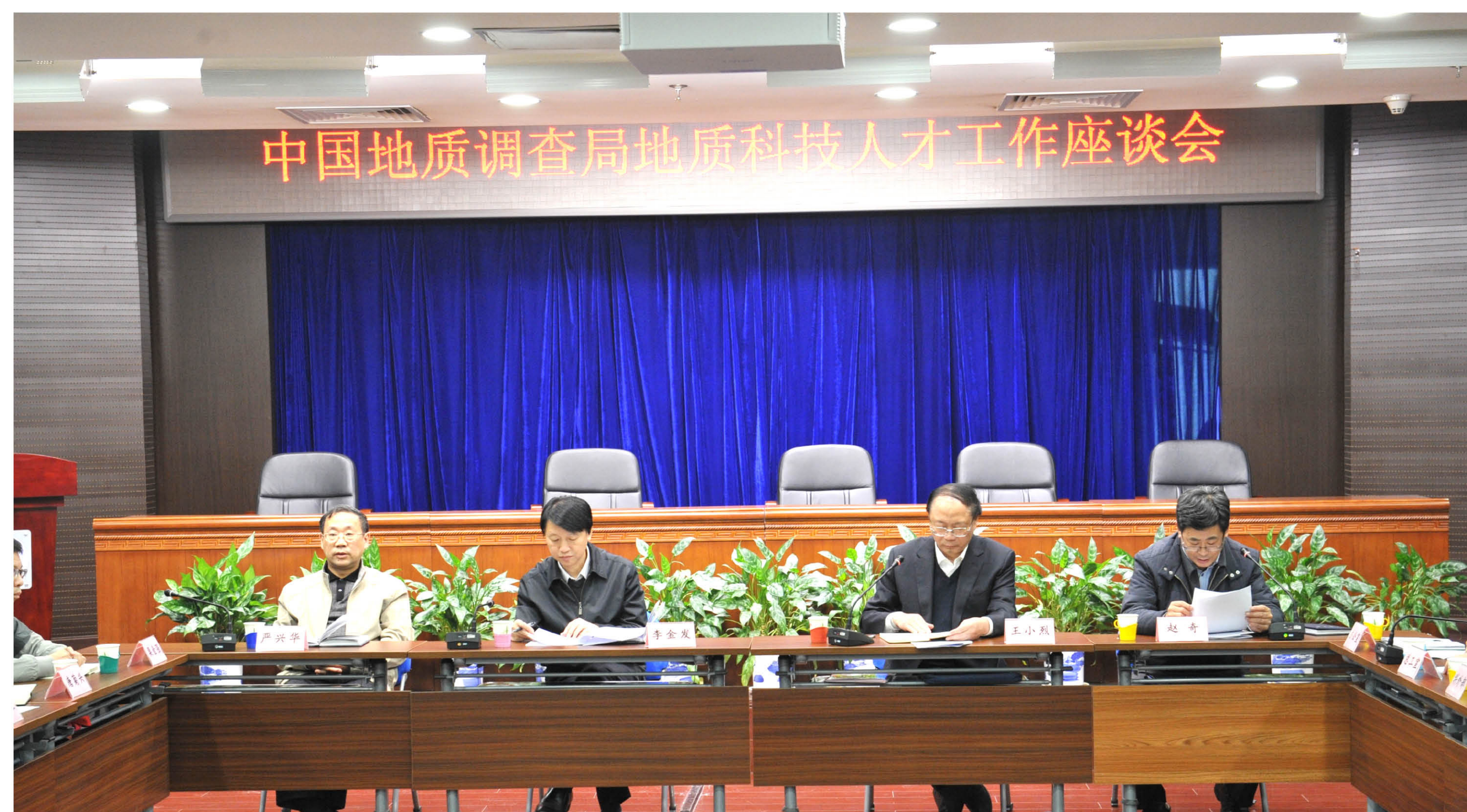
地质科技人才工作座谈会