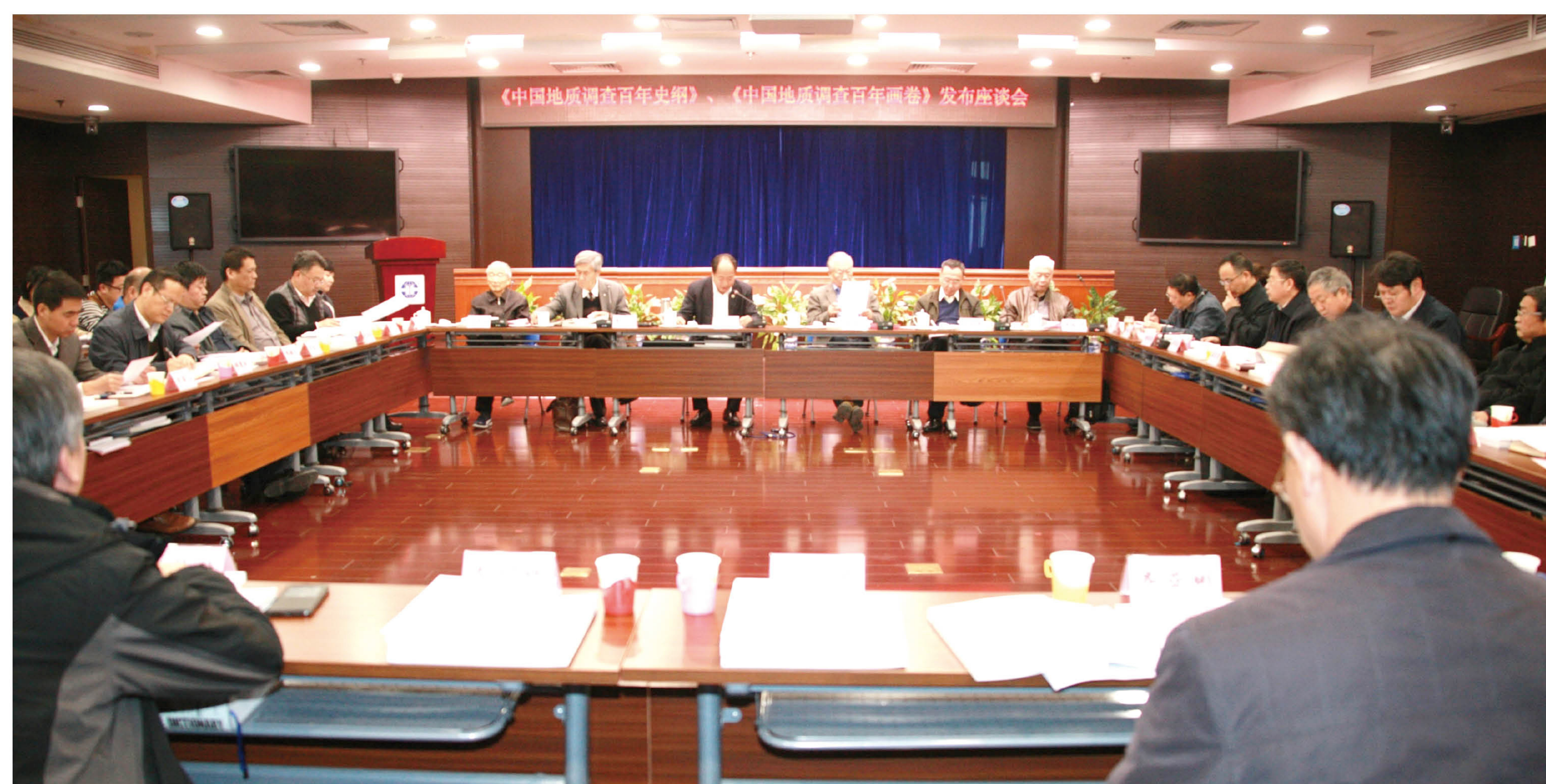
发布《中国地质调查百年史纲》、《中国地质调查百年画卷》