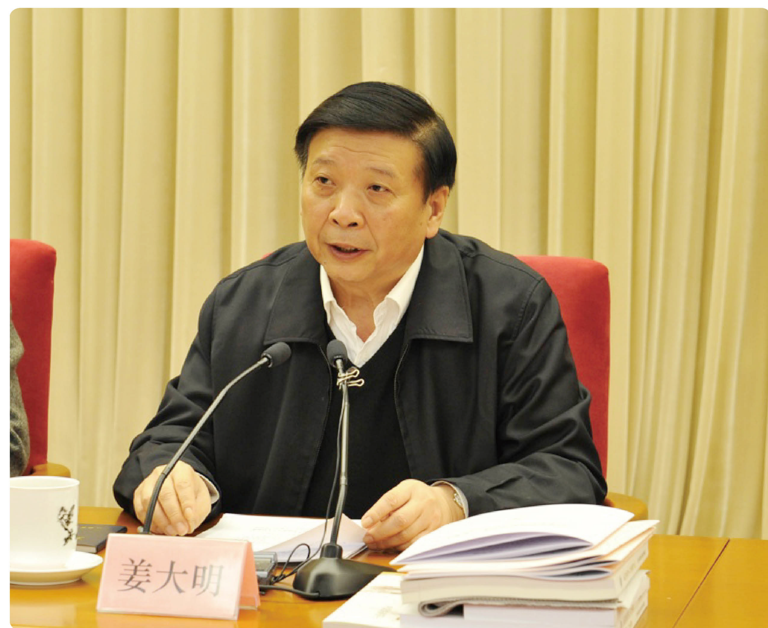
姜大明部长出席中国地质调查科技创新大会暨纪念中国地质调查百年学术研讨会

2016年11月8日，中国地质调查局隆重召开中国地质调查科技创新大会暨纪念中国地质调查百年学术研讨会，姜大明部长在大会上发表讲话，提出了加快建设世界一流的新型地质调查局，肩负起向地球深部进军的历史使命。为地质调查事业第二个百年的发展指明了方向，明确了任务。