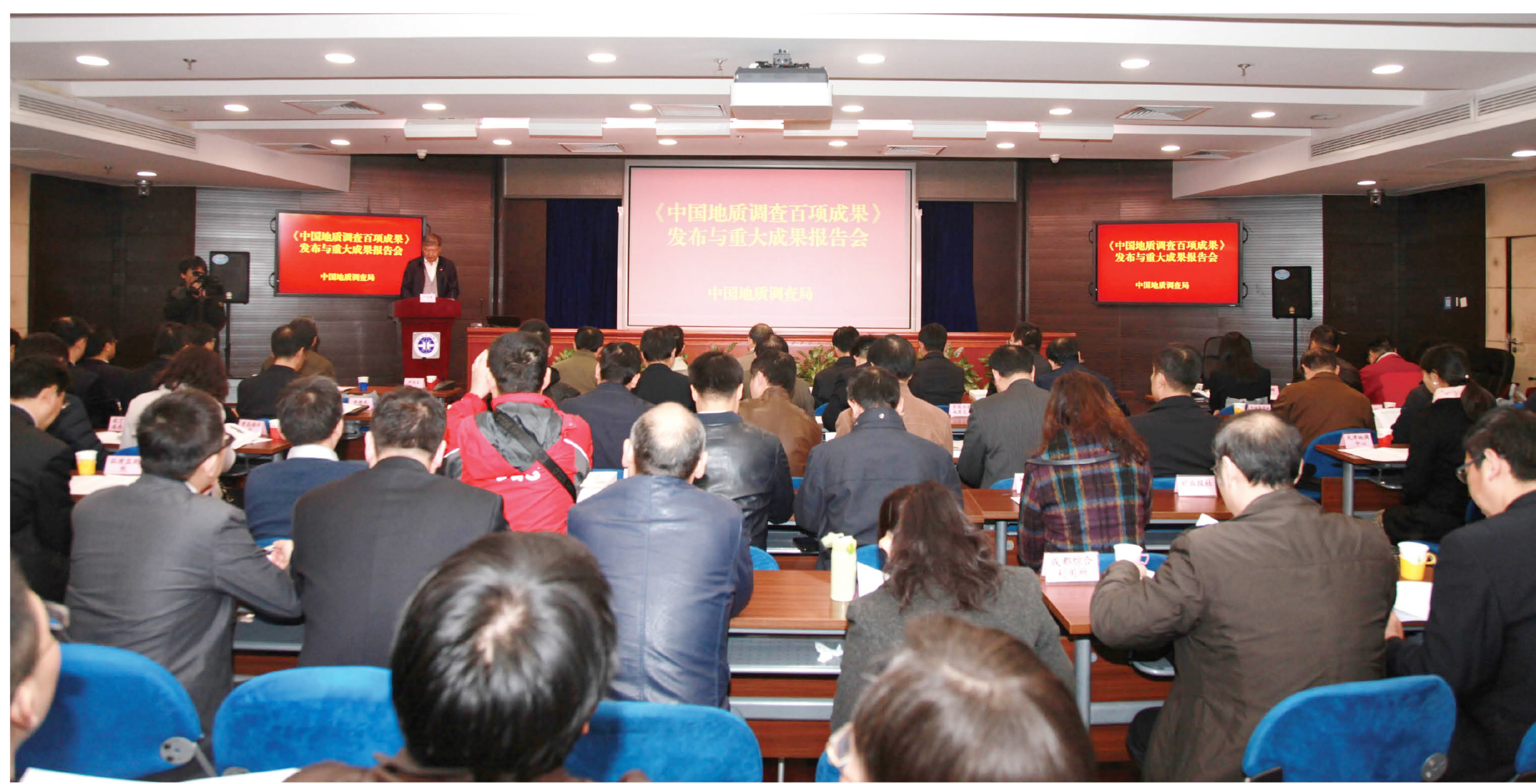
发布《中国地质调查百项成果》