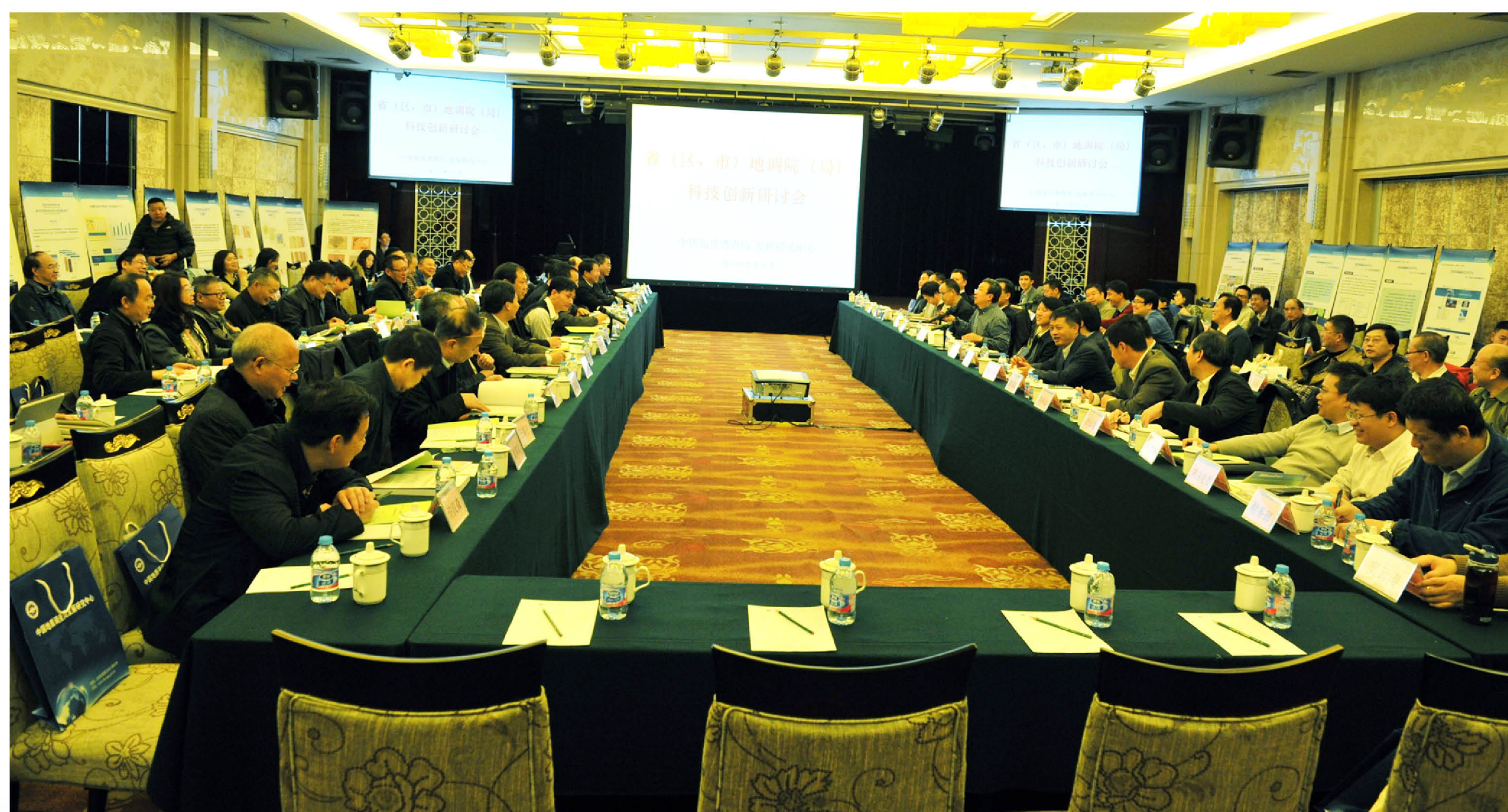
省（区、市）地调院（局、中心）、 地质环境监测总站（院、中心）科技创新研讨会