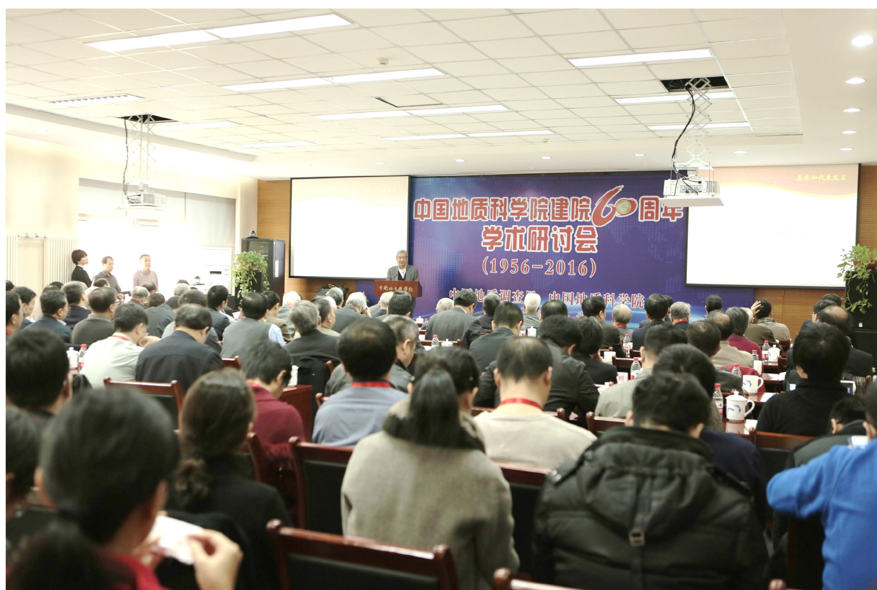
中国地质科学院建院 60 周年学术研讨会