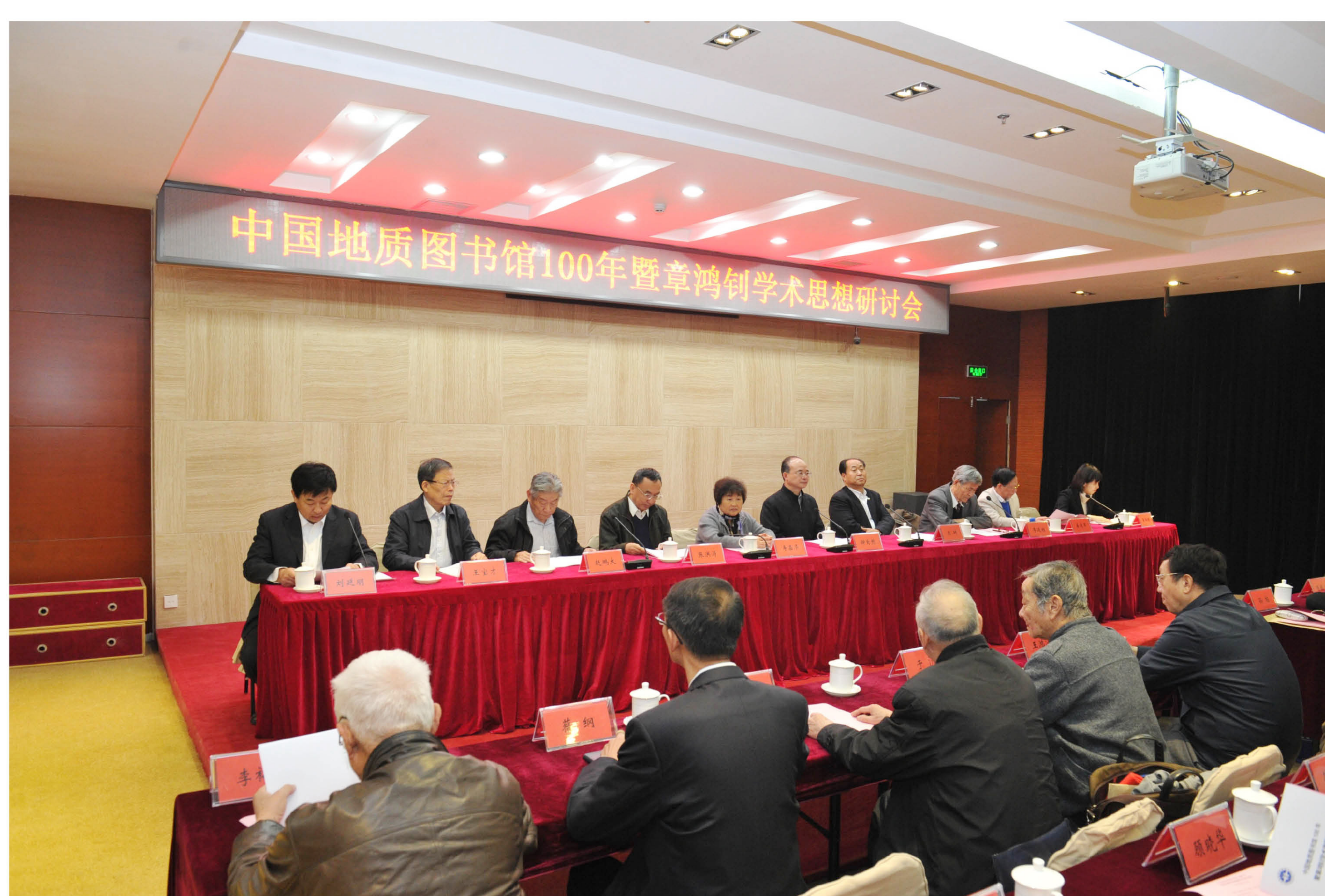
中国地质图书馆章鸿钊学术思想研讨会