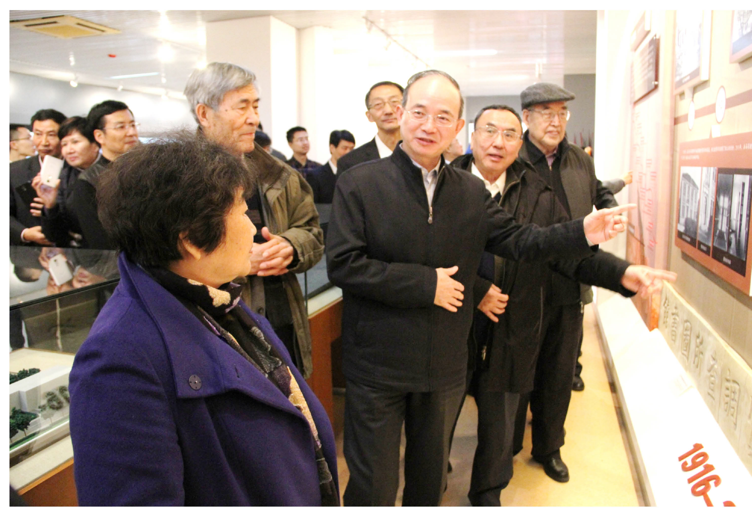
地质宗师章鸿钊 授业解惑传爱存——章鸿钊先生实物展